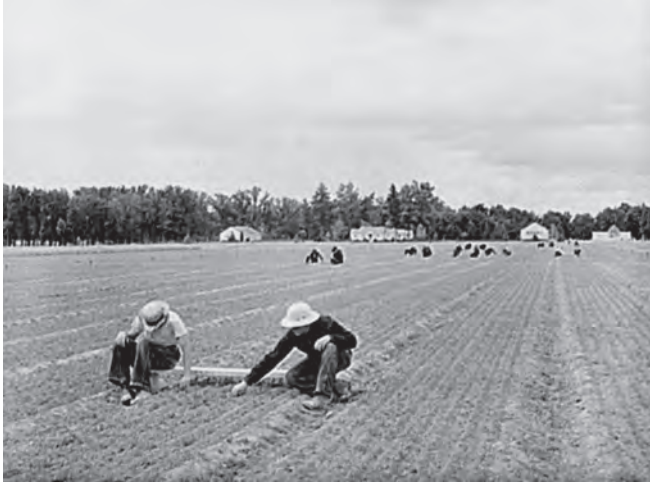
شكل ٦-١: أطفال ينتمون لسلك الخدمة المدنية يزعجون الحشائش من مشتل تابع لهيئة وادي تينيسي بالقرب من سد ويلسون في ولاية ألاباما.

للجنوبيين من البيض أن يتقبّلوها، وكثيراً ما عقدت المدن الجنوبية استفتاءاتٍ صوّتَ فيها المواطنون لصالح السلطة العامة ضد الشركات المحتكرة الخاصة، في ظل دعمٍ من ليلينثال. جاءت مقاومةٌ قويةٌ غنيّةٌ بمصادر التمويل لهذه الاستفتاءات من مؤسساتٍ الطاقة الخاصة التي تملكها شركة «كومولث آند ثاذرن» القابضة، التي ترأسها وينديل ويلكي، الديمقراطي الذي دعم روزفلت في عام ١٩٣٢. وقد أضعفت هيئة وادي تينيسي من مَيلٍ ويلكي نحو الإدارة؛ ففي حين تفاوَضَ ويلكي نفسه مع الهيئة، حارَبَ توسّعها أعضاء في الشركات المشكّلة لكومولث آند ثاذرن، وكانت استجابة الهيئة والمدن الجنوبية بأن عملوا على إقناع إدارة الأشغال العامة ببناء خطوط ووحيدات لمنافسة شركات الطاقة الخاصة، أو حتى مجرد التخطيط لبنائها، وجعل الجنوب في غنى عنها. وكثيراً ما وُقِرَت خطط إدارة الأشغال العامة وحدها النفوذ الفيدرالي الكافي، فباعَت شركات الطاقة الخاصة بنيتها التحتية وآلَت إلى السيطرة العامة المحلية. 8