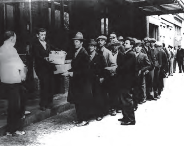
شكل ٣-١: يقف هؤلاء الرجال في طابور الخبز بمدينة نيويورك عام ١٩٣٢.

هذا العبء أكثر من ذلك. ويأخذ السلع من البقال بالحي، واللحم من الجزار بالأجل. ويؤجل صاحب العقار تحصيل الإيجار حتى يحين دفع الفائدة والضرائب ويتعين القيام بشيء ما. يستنفد كل هذه المصادر في النهاية على مدار فترة من الزمن، ويصبح من الضروري لهؤلاء الناس، الذين لم تكن لديهم حاجة أبداً من قبل، أن يطلبوا المساعدة. 6 عندما خذلت الأسرة والجيران العمال، كان بإمكانهم أحياناً الحصول على المساعدة من صناديق المساعدة المشتركة التي كان يجري تنظيمها محلياً مثل خطط الأيام العسيرة أو أموال الأرملة والأيتام التي يخصصها اتحاد من الاتحادات العمالية أو مجموعة من مجموعات العمل المدني. وغالباً ما أعدّ الأمريكيون تلك الخطط في إطار مجتمعاتهم الدينية أو العرقية، من باب الكبرياء، للحنول دون اضطرار واحد من بني جلدتهم إلى اللجوء إلى المؤسسات الخيرية أو إلى ما كانوا يشعرون أنه أكثر مهانة، وهو اللجوء إلى الغوث الحكومي. ولذا استمر الأمريكيون البولنديون والأمريكيون الألمان وكنائس الأبرشيات ومرتادوها وغيرهم من مختلف المجتمعات في مساعدة الوكالات التي حاولت تقديم العون إلى المكروبين منهم ومؤازرتهم حتى يأتيهم العمل. وقد صرّح أحد الكهنة