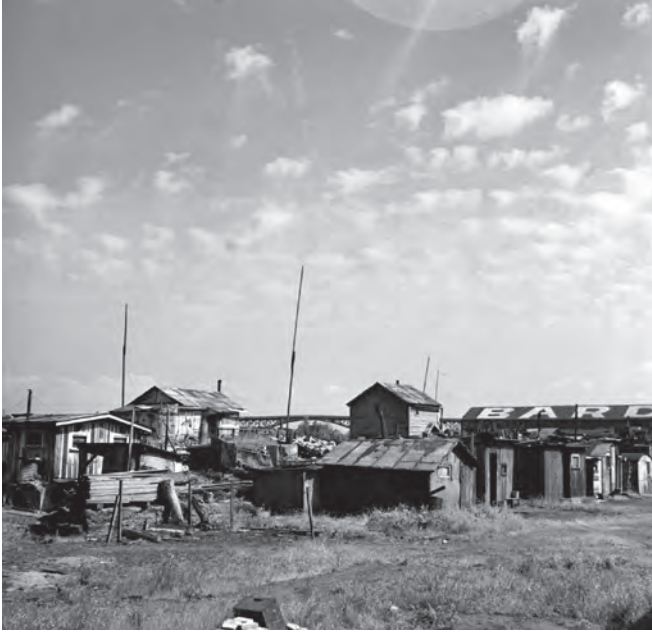
شكل ٢-٣: أكواخ واضعي اليد تحتلُّ ضفّتي نهر ويلامت في إحدى «مدن هوفر» بالقرب من بورتلاند، بولاية أوريغون.

التوقيت التاريخي؛ فالأمريكيون السود، الذين كانوا لفترة طويلة سكاناً للريف، انتقلوا عموماً إلى المدن منذ وقتٍ ليس ببعيد، وأُتيحت لهم فُرصٌ أقل لتطوير حياتهم المهنية كعمالٍ مَهْرَةٍ مقارنةً بالأمريكيين البيض. ولكن لم يشكّل نقص المهارات النسبي إلا جزءاً من معدلات البطالة العالية لدى الأمريكيين من أصول أفريقية، وقد لاحظَ العمال السود أنهم «أخِر مَنْ يُعَيَّن، وأول مَنْ يُطْرَد من العمل»، وأن أبواب العمل يسرحون العمال السود عن عمدٍ من أجل أن يستبدلوا بهم عمالاً بيضاً. وقد خلصت دراسة أجرتها الرابطة الحضرية الوطنية في عام ١٩٣١ إلى أنه «كانت هذه الممارسة شائعة جداً بما يجعل المرء يجد ما يبرّر ظنه بأن هذا الإجراء كان يجري تطبيقه كوسيلةٍ للتخفيف من بطالة البيض دون اعتبارٍ لتبعات ذلك على الزوج» 18 .