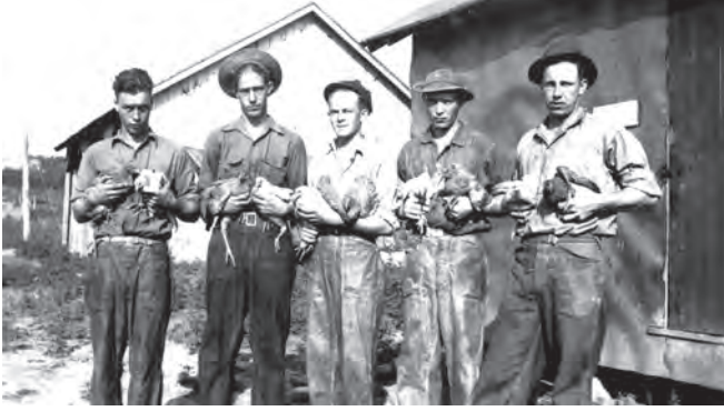
شكل ٥-١: عمل هؤلاء الرجال، وهم أعضاء في سلك الخدمة المدنية، بمرزعة لتربية الدواجن في جونزفيل، بولاية فيرجينيا.

لم يُعَنَّ أيُّ من مخططي السياسة الزراعية بتناول مشكلات الأمة الأزلية المتسبِّب فيها فقرُ المناطق الريفية، أو المشكلات الجديدة التي نتجت عن الكساد الكبير. كان الهدف من القانون تحديداً هو القضاء على عدم التكافؤ في القوة الشرائية بين الريف والمدينة عن طريق العودة إلى عصرٍ ذهبيٍّ خياليٍّ، وليس بالمضي قُدماً إلى عالم جديد تماماً. ولما كان القانون بعيداً كلَّ البُعد عن تحفيز انتعاش الاقتصاد عن طريق مساعدة أغلبية المشترين بالدولة، فرضتِ الضرائبُ التنازلية على إنتاج السلع، التي انتقلت إلى المستهلكين، عقوباتٍ على المشترين في الحضر لمصلحة البائعين في الريف.