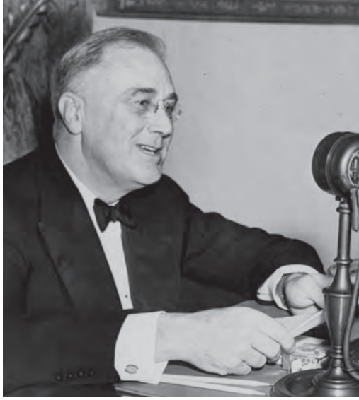
شكل ٤-١: فرانكلين دي روزفلت جالس خلف الميكروفون أثناء أحد أحاديثه إلى جانب المدفأة في عام ١٩٣٧.

العام الأمريكي بهذا الإجراء، عن طريق المزيج الساحر من لكتته الأرستوقراطية ولغته الواضحة؛ وفي هذه الحالة لن يسع الأمريكيين سوى أن يقولوا: «كان لدينا نظام مصرفي سيء.» وستجاوز روزفلت أيضاً الأسلوب غير الرسمي البسيط ليستخدم الشرح المنهجي للظروف وسياسته، محاولاً بصدق أن يشرح التفاصيل الفنية للحالة الطارئة واستجابته لها. ورغم تهور الإجراء الذي اتخذه روزفلت، فإنه كان يسعى إلى تحقيق أهداف محافظة في الأساس. وكما كتب فيما بعد رايmond مولي، أحد مستشاري روزفلت، فإنه نتيجة لإجازة البنوك «أنقذت الرأسمالية في ثمانية أيام.» 7 أو على الأقل جزء من الرأسمالية، على أية حال. ومع تحقيق إنجازات على هذا المنوال، يمكن أن تتحسن الأزمة التي وجد البلد نفسه يسقط فيها تدريجياً، لتكتسب الإدارة قدرًا من المصداقية وربما الحرية لإجراء إصلاح إضافي ودائم للنظام الاقتصادي الأمريكي.